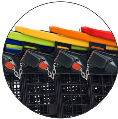
Cadena inicio Starter chain