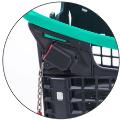
Monedero adaptado Adapted coin lock