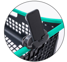
Portamóviles Mobile phone holder