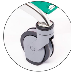
Ruedas para rampas Travelator wheels