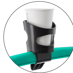
Porta-bebidas universal Universal drink holder