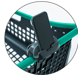
Portamóviles Mobile phone holder