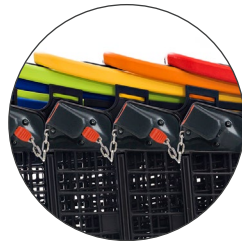
Cadena inicio Starter chain