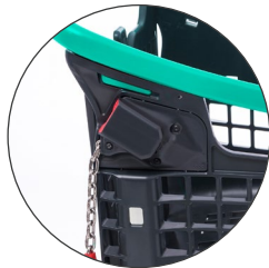
Monedero adaptado Adapted coin lock